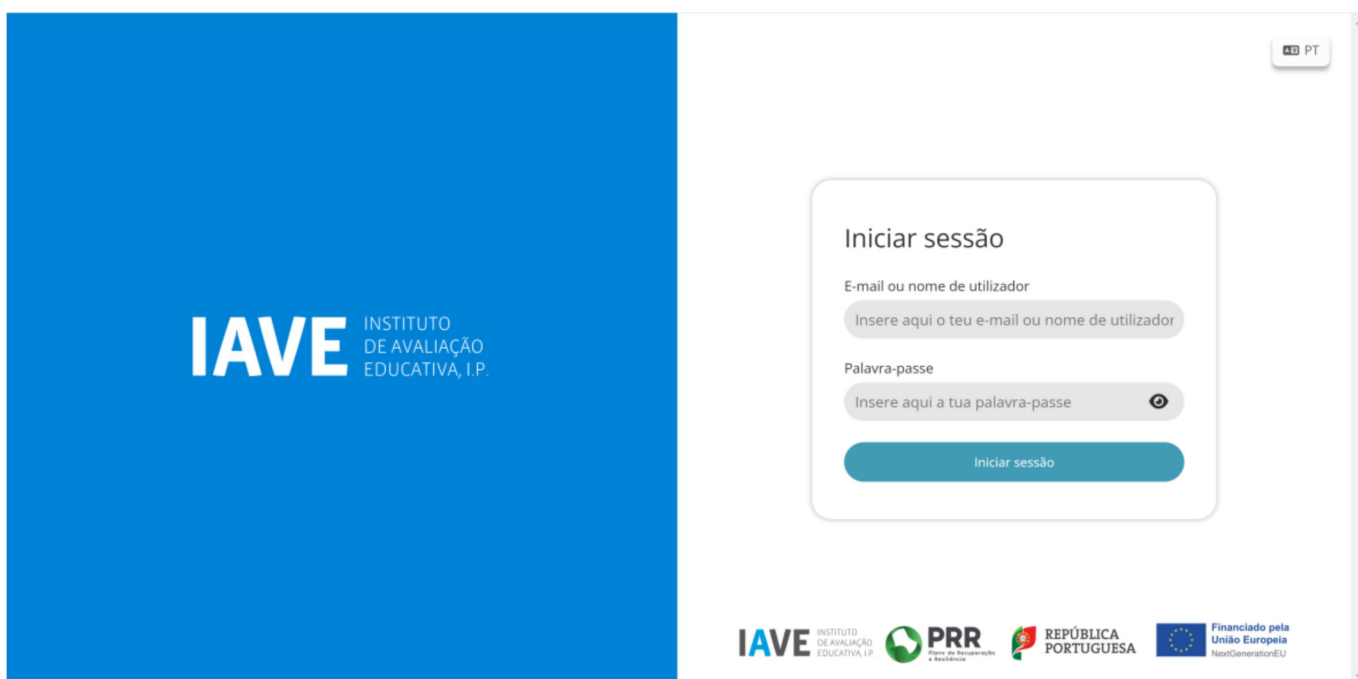
Figura 1 – Acesso à Plataforma de Realização das Provas Eletrónicas do IAVE

O(s) vigilante(s) pode(m), em caso de necessidade, introduzir as credenciais no computador do aluno, para que este consiga aceder à prova.